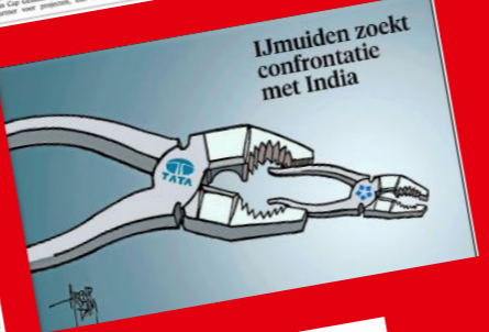
IJmuiden zoekt confrontatie met India

FNV 'onthutst' over Tata Steel Nationaal geschied door tariefloze koers van B.T.