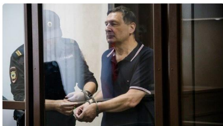
Started March 11, 2024 Petition to Supreme Court of the Russian Federation