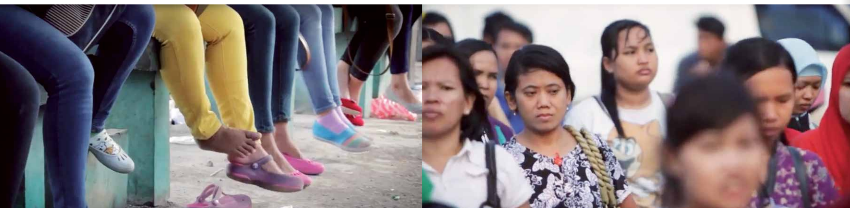
Reeks stills uit de film ‘The day the voices raised’.

“Hoe vaak zitten de technici aan je?” vraagt een vakbondsvrouw aan een textielwerknemers. “Heel vaak”, antwoordt ze. “Ze hebben ook vieze praatjes.” Het speciaal opgerichte Women Workers Committee van de EPZ bespreekt schriftelijke klachten van vrouwen. “Soms komt de baas ’s ochtends binnen, slaat z’n armen van achteren om me heen en grijpt dan naar m’n borsten”, leest iemand voor. Het is de start van een fascinerende reis langs allerlei sleutelfiguren die voor het idee van het billboard gewonnen moeten worden. Van collega’s, fabriekseigenaren tot hoge ambtenaren en alles ertussen. De vrouwen spreken vol zelfvertrouwen en winnen uiteindelijk het pleidooi.